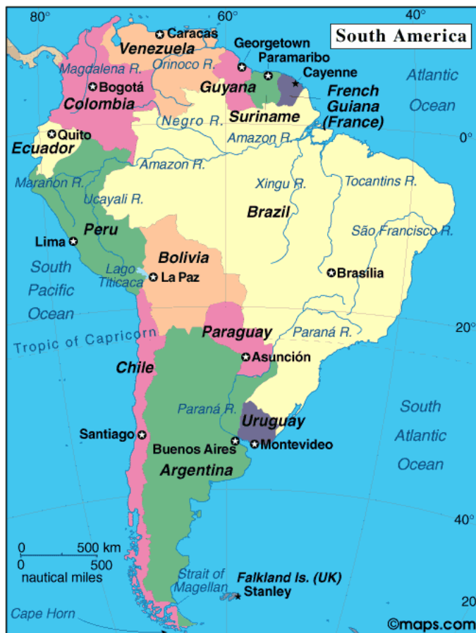
Figura 1- Localização do Brasil

A localização geográfica do Brasil e suas características políticas, econômicas e sociais enquadram-no em determinados blocos de nações. Quando havia o chamado conflito leste-oeste, o Brasil assumia sua posição de país ocidental e capitalista; como país meridional, no diálogo norte-sul, alinha-se entre os países pobres (do sul); e como país tropical compõe o grupo dos países espoliados pelo colonialismo europeu e posteriormente pelo neo colonialismo dos desenvolvidos sobre os subdesenvolvidos.