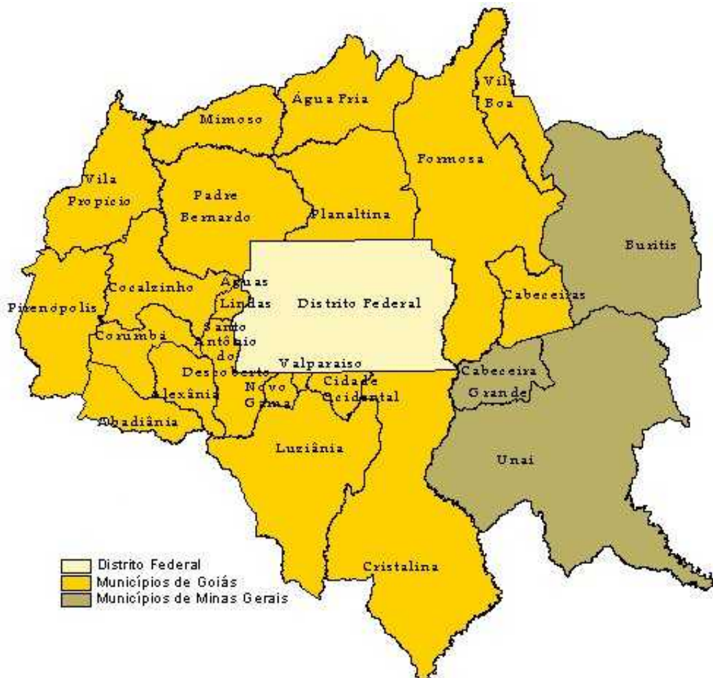
Figura 2 - Distrito Federal e os municípios limítrofes do Estado de Minas Gerais e do Estado de Goiás

Sua área é de 5.789,16 km 2 , equivalendo a 0,06% da superfície do País, apresentando como limites naturais o rio Descoberto, a oeste e o rio Preto, a leste. Ao norte e ao sul, o Distrito Federal é limitado por linhas retas, que definem o quadrilátero correspondente à sua área. Limita-se a leste com o município de Cabeceira Grande, pertencente ao Estado de Minas Gerais, e com os seguintes municípios do Estado de Goiás; ao norte: Planaltina de Goiás, Padre Bernardo e Formosa; ao sul: Luziânia, Cristalina, Santo Antônio do Descoberto, Cidade Ocidental, Valparaíso e Novo Gama; a leste: Formos; e a oeste: Santo Antônio do Descoberto, Padre Bernardo e Águas Lindas (Fig. 2).